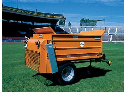
Champion GS 20