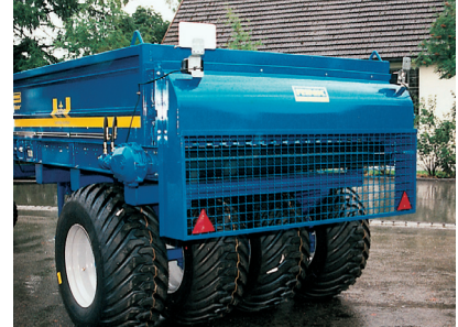
Master GS 30