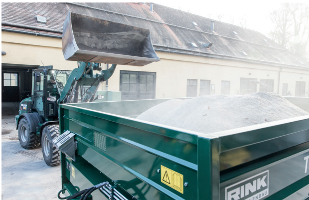
Die Maschine kann mit breiten Ladeschaufeln schnell und effizient geladen werden (hinten 2,00 m / seitlich 3,00 m)