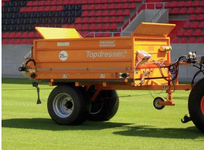
Topdresser GS 15