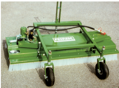
Rotationsbürste GB 15