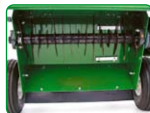
Die Messerzahl kann von 15 auf 30 Stück beliebig erweitert werden.